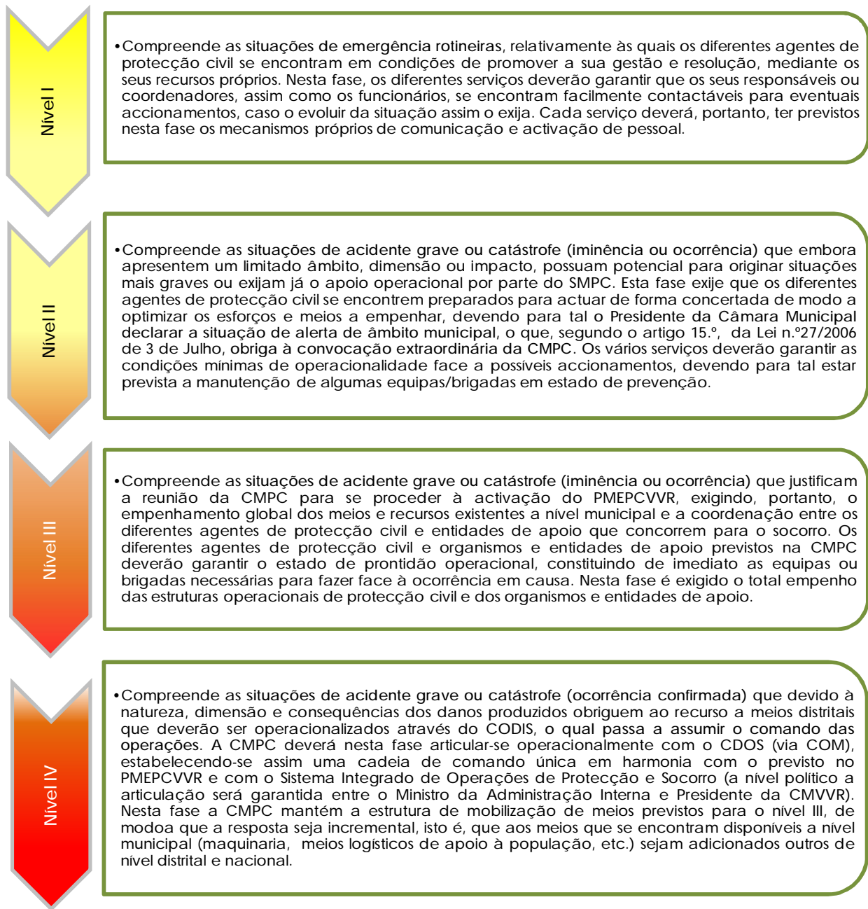
Figura 2. Níveis de intervenção na fase de emergência