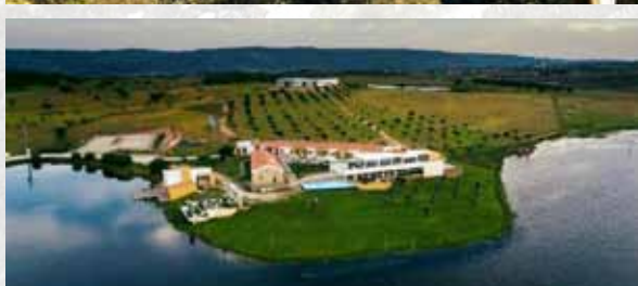
Herdade da Urgueira