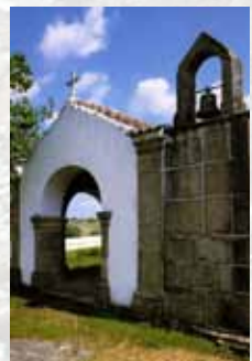
Capela de N. S. dos Remédios (Freguesia de Perais)