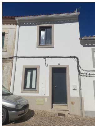
Largo do Pelourinho no.14