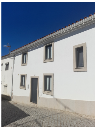
Rua 25 de abril no.77