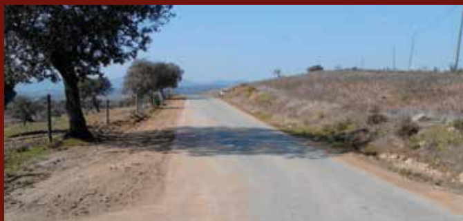
Beneficiação das bermas e valetas nas estradas de acesso a Vale de Pousadas