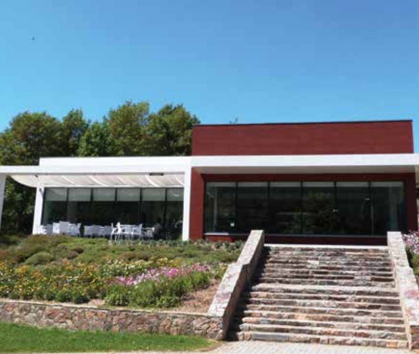
Restaurante Bar Vila Portuguesa