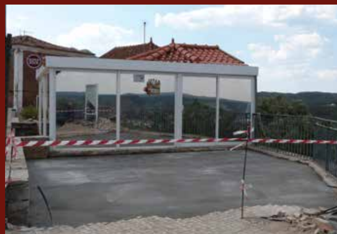
Beneficiação / remodelação das instalações sanitárias do Quiosque da Vila e zona envolvente, Vila Velha de Ródão