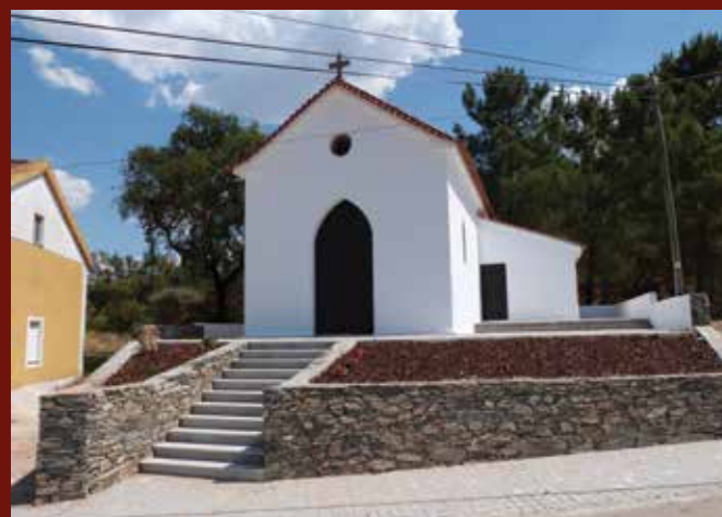
Construção do adro da Capela do Espírito Santo, e beneficiação da zona envolvente, Fratel