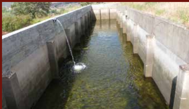
Ampliação, em altura, do tanque de rega do Cabeço Salvador, Vila Velha de Ródão