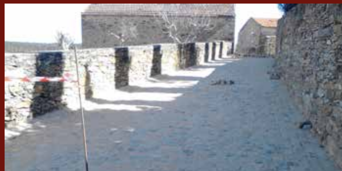
Repavimentação de calçadas, nos locais da execução de ramais e outras reparações de calçada realizadas nas diversas freguesias