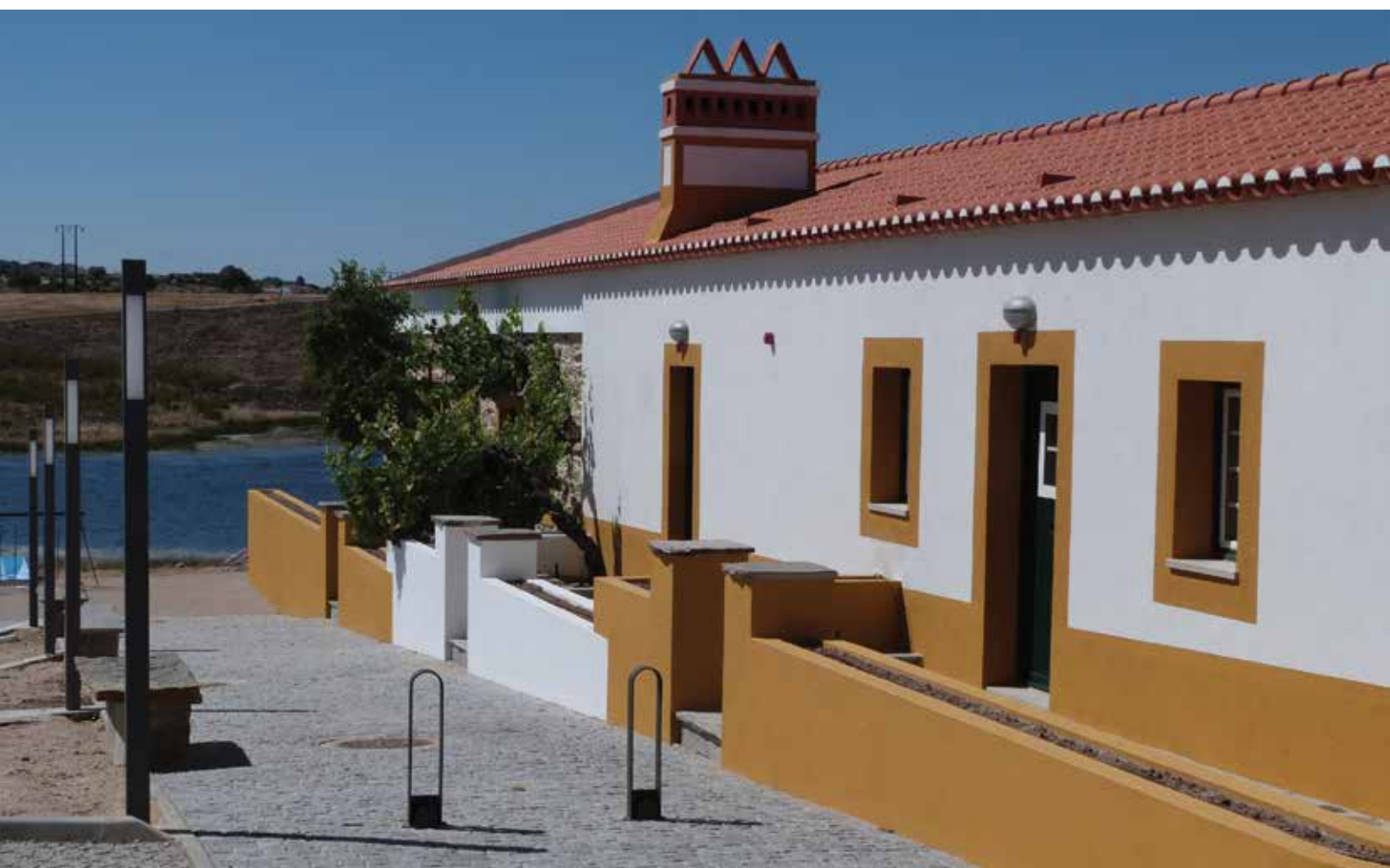
Empreendimento de Olivoturismo - Herdade da Urgueira