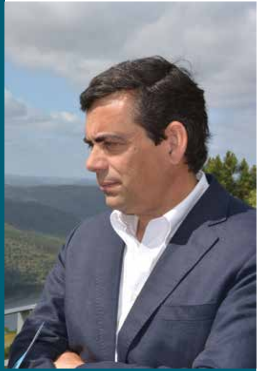
O Presidente da Câmara Municipal

O mês de Junho ficará ainda registado como o mês em que foram concluídos, importantes empreendimentos privados na área do turismo reforçando-se, desta forma, a oferta disponível neste sector estratégico para o desenvolvimento do concelho, em que o município ao longo dos últimos anos, tem vindo a concretizar significativos investimentos.