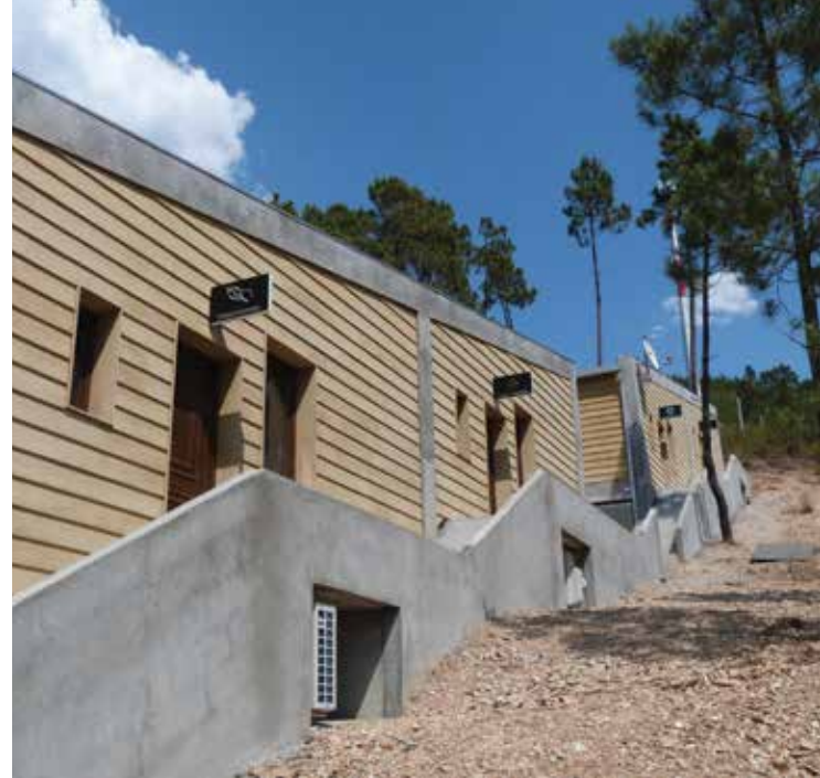
Casas do Almourão