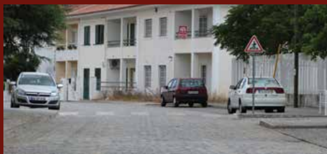
Criação de lombã/passadeira e colocação de sinalização de segurança, em frente ao jardim de infância, Vila Velha de Ródão