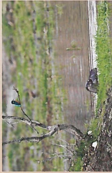
Lontra e guardan-fios

Após a saída de Vilas Ruivas, caminhando pelo flanco poente do Vale do Lameirão, a aproximação ao omnipresente Tejo faz-se através de um antigo terraço fluvial, à cota de 130 metros, onde, há cerca de 50.000 anos, o homem pré-histórico estabeleceu um acampamento temporário e onde se descobriram duas lajeiras caloríferas, protegidas por para-ventos, como o indicariam os buracos de poste identificados no momento da intervenção arqueológica.