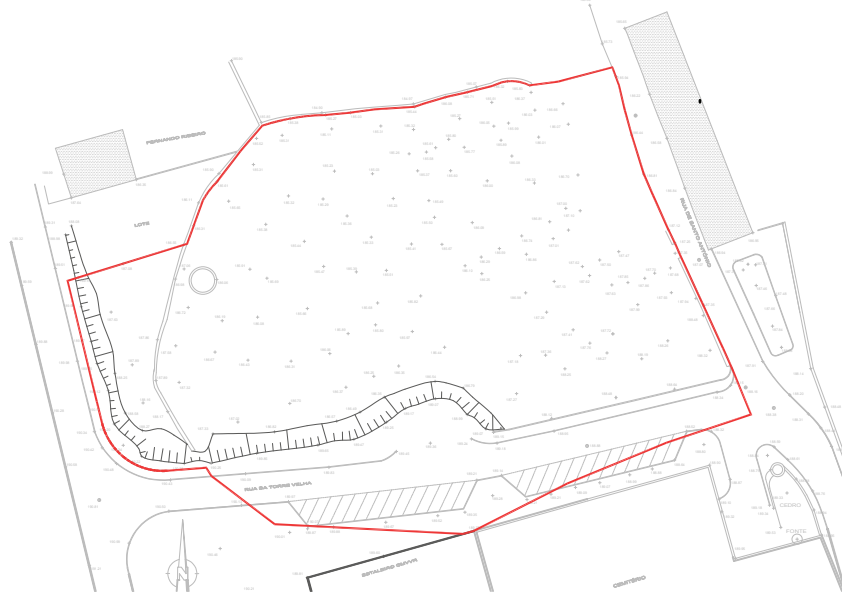
Fase 2 Emparcelamento dos diversos prédios Prédio resultante = 7985m 2