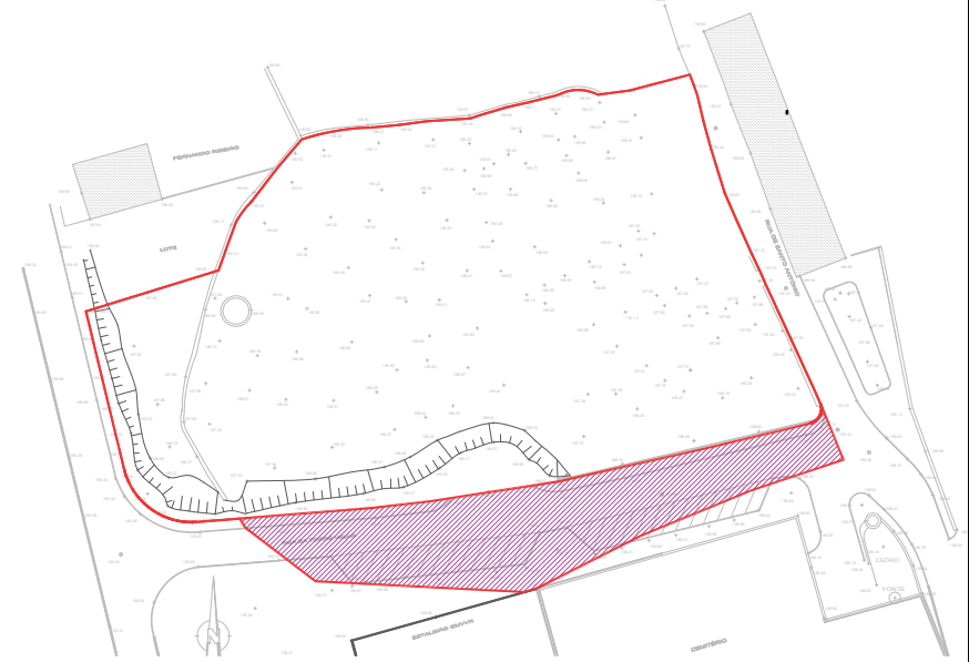
Fase 3 Em simultâneo ao emparcelamento, é cedida área ao domínio público, que já se encontra afeta a espaço público, como parte da rua da Torre Velha = 1269m 2